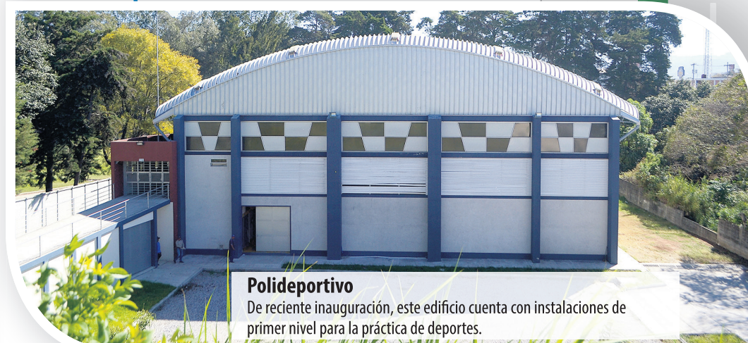
Polideportivo De reciente inauguración, este edificio cuenta con instalaciones de primer nivel para la práctica de deportes.