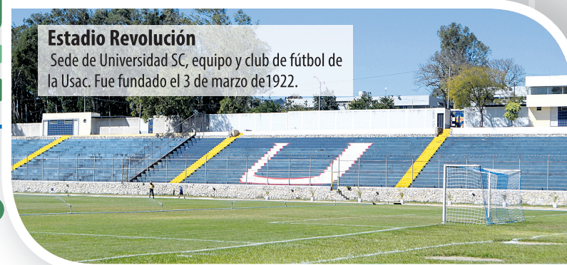
Estadio Revolución Sede de Universidad SC, equipo y club de fútbol de la Usac. Fue fundado el 3 de marzo de 1922.