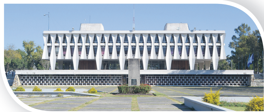
Rectoría Sede de la máxima autoridad universitaria: el Consejo Superior Universitario, integrado por el rector, secretario general, director financiero, director de Asuntos Jurídicos, decanos de las facultades, un representante de cada colegio profesional, representantes estudiantiles y docentes de cada facultad.