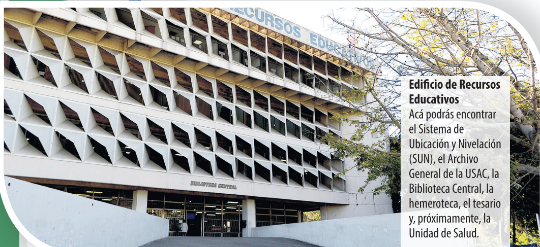
Edificio de Recursos Educativos Acá podrás encontrar el Sistema de Ubicación y Nivelación (SUN), el Archivo General de la Usac, la Biblioteca Central, la hemeroteca, el tesario y, próximamente, la Unidad de Salud.