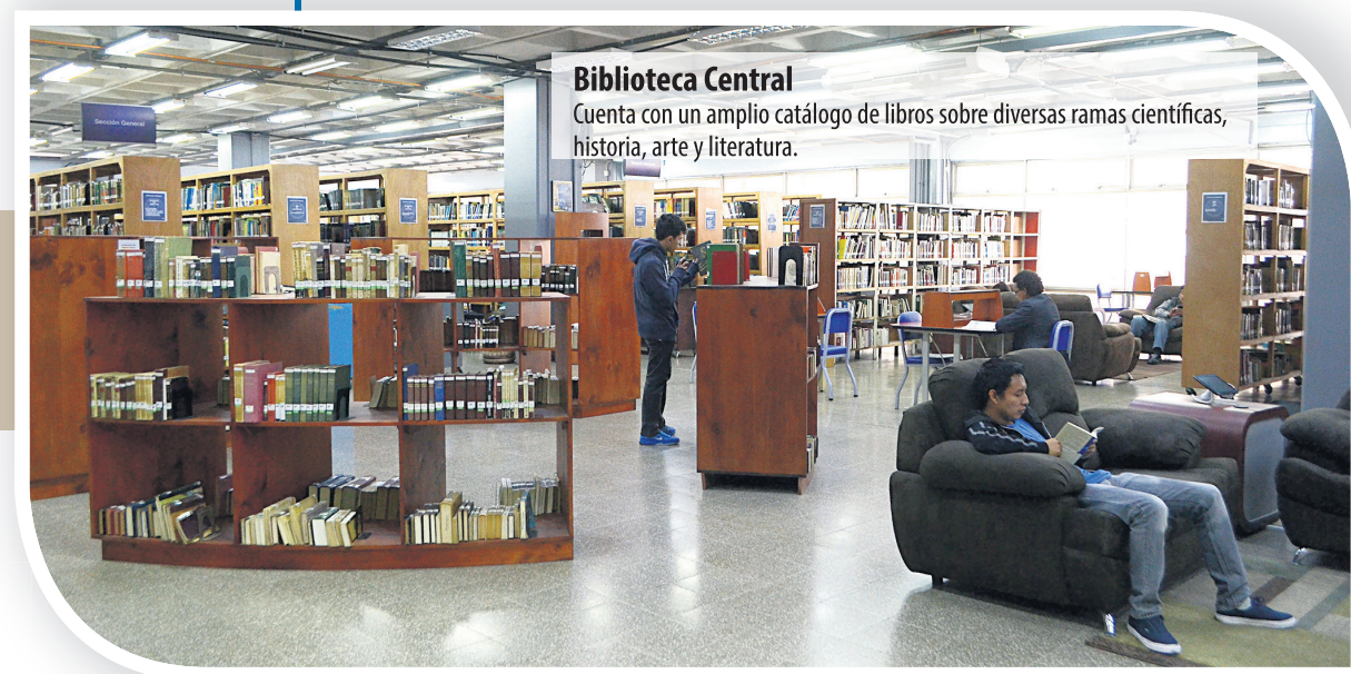
Biblioteca Central Cuenta con un amplio catálogo de libros sobre diversas ramas científicas, historia, arte y literatura.