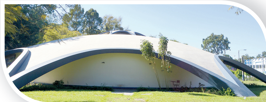
IGLÚ El 20 de julio de 1964 fue inaugurado el anfiteatro de la Universidad de San Carlos de Guatemala, conocido popularmente como el "Iglú" por su diseño arquitectónico. Tuvo un costo de Q 85 mil y fue destinado para los cursos del departamento de estudios básicos.