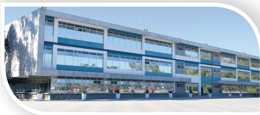
Dirección General de Administración (DIGA) Es uno de los edificios más nuevos de la Usac, en este se encuentra Registro y Estadística.