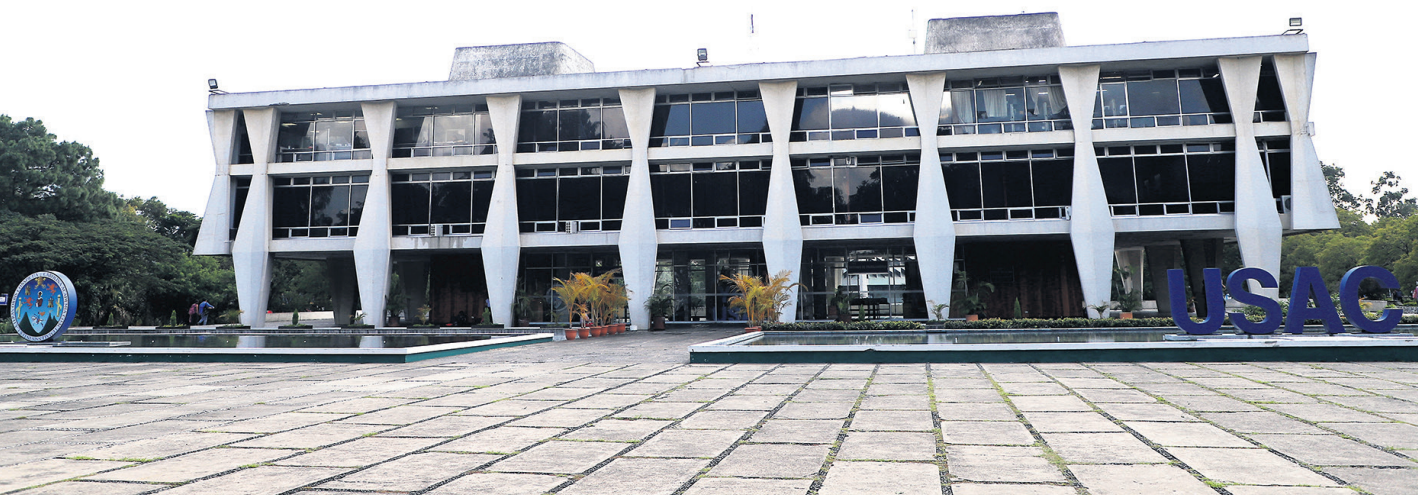
75 años de autonomía universitaria