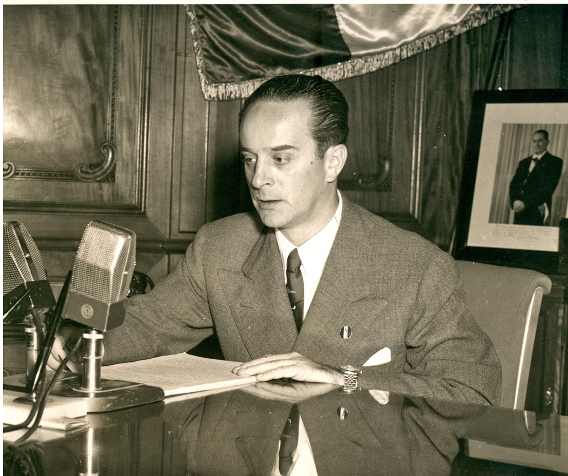
Árbenz pronunciando su discurso de renuncia a la presidencia el 27 de junio de 1954, tras la operación militar planificada por Estados Unidos en su contra.

Posteriormente se potenciaría el antagonismo contra el Gobierno, la presión económica y militar.