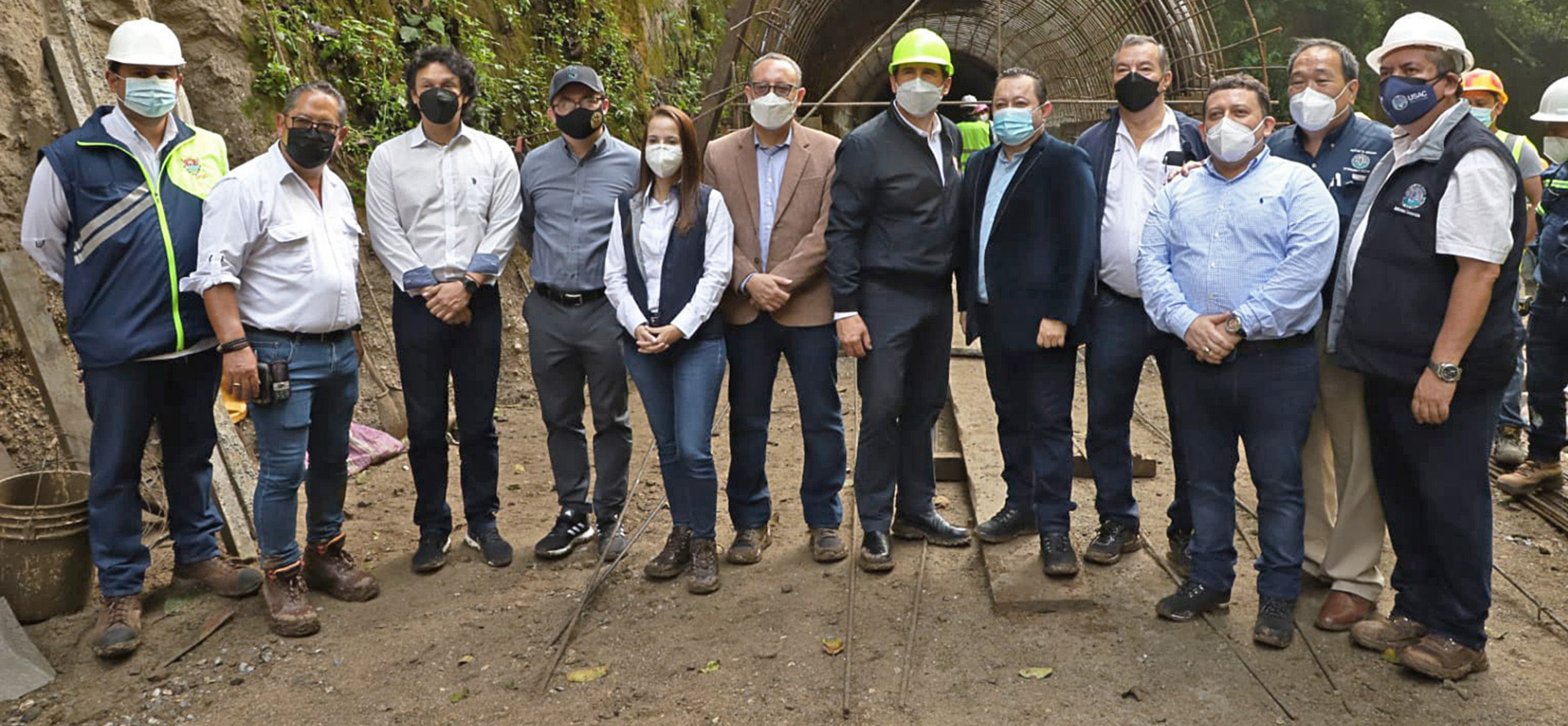
Autoridades universitarias, acompañadas del alcalde municipal de la capital, realizaron un recorrido de supervisión en el colector y los cinco pozos de visita ubicados en el Bosque de las Ardillas. Pág. 3