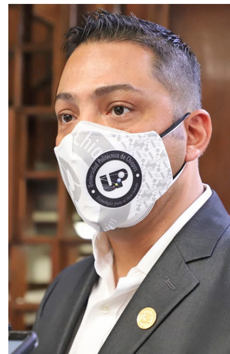
Con la visita del rector de la Universidad Politécnica de Chiapas, se busca estrechar lazos académicos, culturales y sociales.

“La fortaleza de la Universidad Politécnica de Chiapas son las ciencias básicas, es por eso que las disciplinas, carreras y especialidades de la Facultad de Ingeniería de esta casa de estudios pueden tener cabida en las diferentes actividades académicas que realiza la institución mexicana, también se podrá aprovechar la oferta de posgrados que posee”, concluyó.