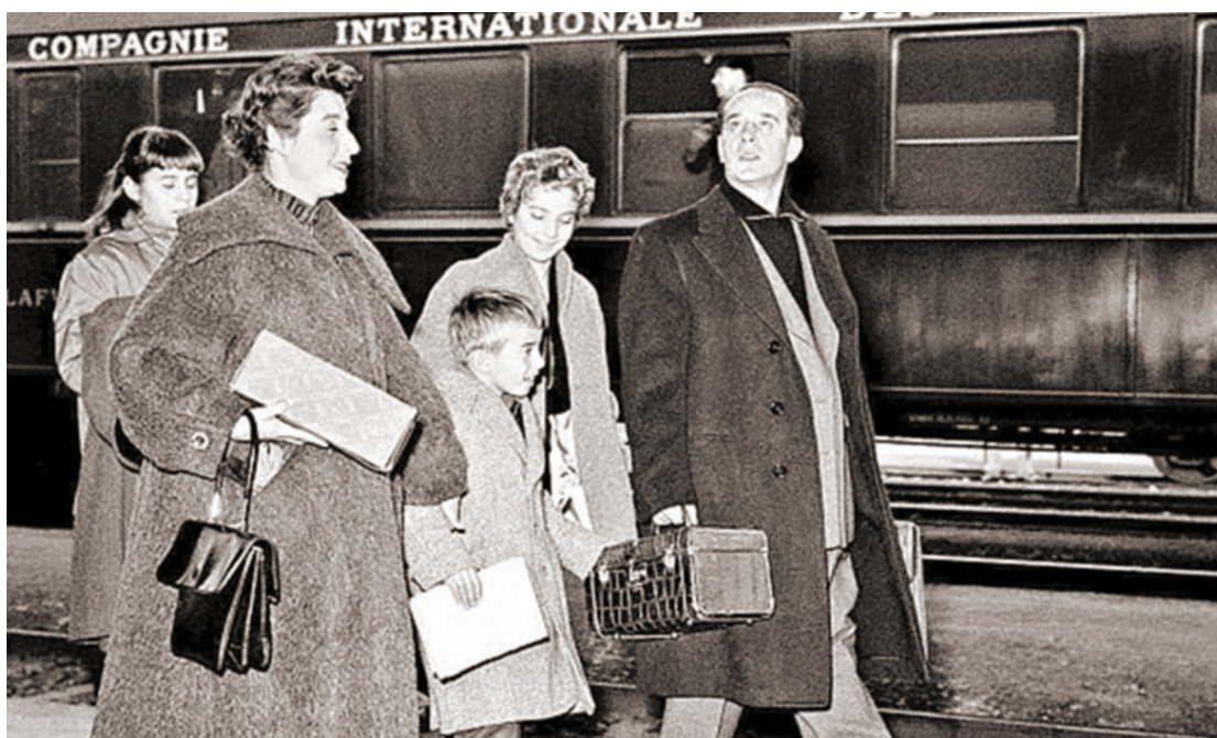
Tras el derrocamiento, Árbenz vivió en el exilio junto a su familia en países como México y Suiza.

Finalmente, Árbenz se vio obligado a renunciar el 27 de junio de 1954. En entrevistas realizadas durante el exilio, reconocía como un error haber confiado en el Ejército: “Pero nunca me imaginé que, ante un caso de agresión extranjera, en que estaban en juego la libertad de nuestra patria, su honor y su