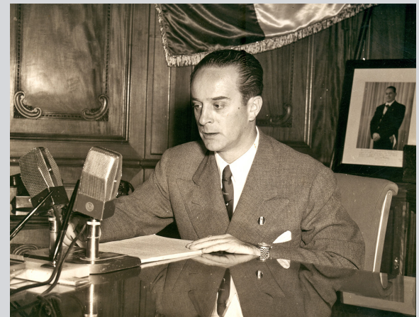
El año de 1944 unió las fuerzas del sector estudiantil, magisterial, obrero, militar y civil contra los constantes flagelos del dictador Jorge Ubico, quien ocupó el poder por 14 años. Pág. 13