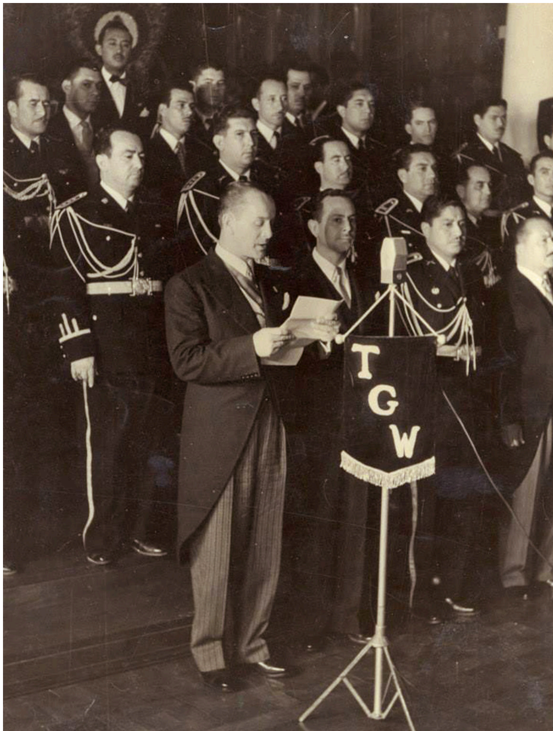
La presidencia de Árbenz abarcó el período de 1950 a 1953, como parte de la Primavera Democrática.

"Mientras en Guatemala perduren los métodos anticuados de trabajo en el campo, mientras en las relaciones entre terratenientes y arrendatarios, entre hacendados y campesinos, subsistan los lazos de la servidumbre y la opresión feudal económica, política y cultural sea la base de esas relaciones, en Guatemala no habrá desarrollo industrial, ni defensa de los intereses nacionales, ni se podrá mantener vigente la democracia", fragmento de discurso de Jacobo Árbenz.