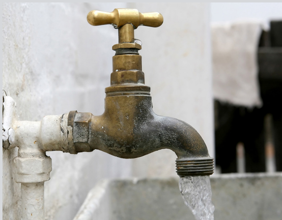
La disponibilidad del vital líquido ya es un problema en la Ciudad de Guatemala, hay sectores con desabastecimiento que se han quedado una semana o más sin este recurso. Págs. 8-9