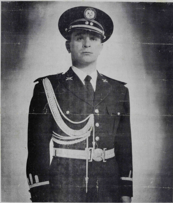
TENIENTE CORONEL JACOBO ARBENZ GUZMAN CANDIDATO A LA PRESIDENCIA DE LA REPUBLICA POR EL PARTIDO INTEGRIDAD NACIONAL 1951-1957

Jacobo Árbenz Guzmán ocupó el cargo de presidente tras haber ganado las elecciones de 1950. Fue apoyado por el Partido de Acción Revolucionaria, Renovación Nacional y el Partido Guatemalteco del Trabajo.