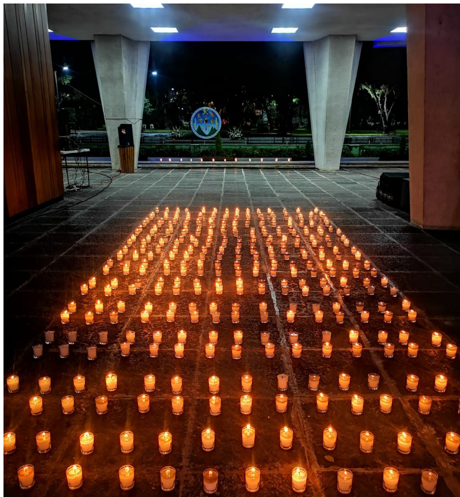
Como parte de la actividad, se colocaron velas blancas, símbolo de luz, pureza y paz, para transmitir un mensaje de fraternidad a los familiares y amigos de quienes perdieron la vida.

Mediante la actividad transmitida en las redes y páginas oficiales, esta casa de estudios patentizó su apoyo y estima a los familiares, compañeros y amigos de quienes fallecieron. Asimismo, reconoció y agradeció el valioso legado que dejaron las víctimas de la enfermedad COVID-19.