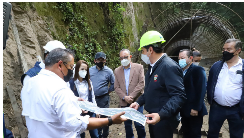
Durante el recorrido realizado, autoridades universitarias y municipales supervisaron mediante planos la obra que fue llevada a cabo.

Longitud: 1102 metros lineales de alcantarillado