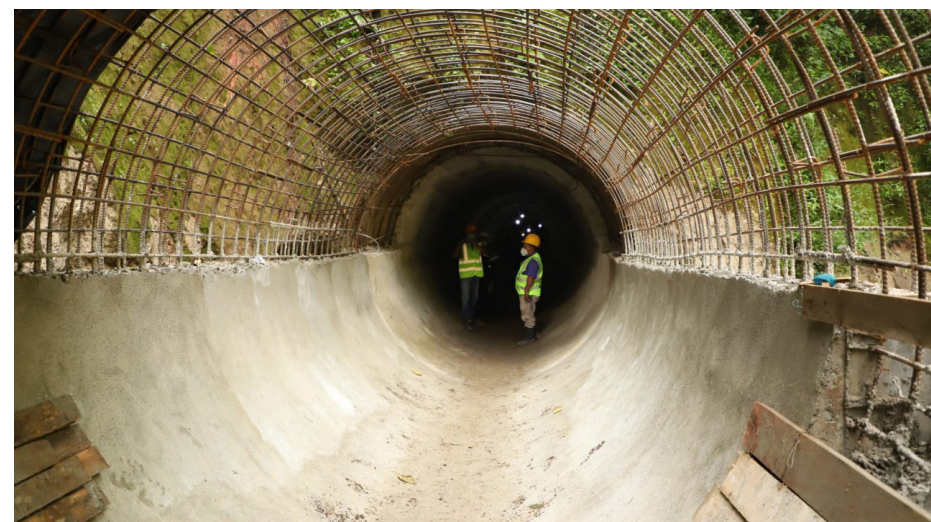
La obra ha avanzado en un 95 %, únicamente falta conectar el colector nuevo con el antiguo.