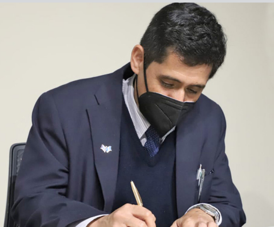
En el evento internacional participaron alrededor de 500 personas de 19 países. Además, se firmó una carta de entendimiento para realizar investigaciones sobre los temas abordados. Pág. 10