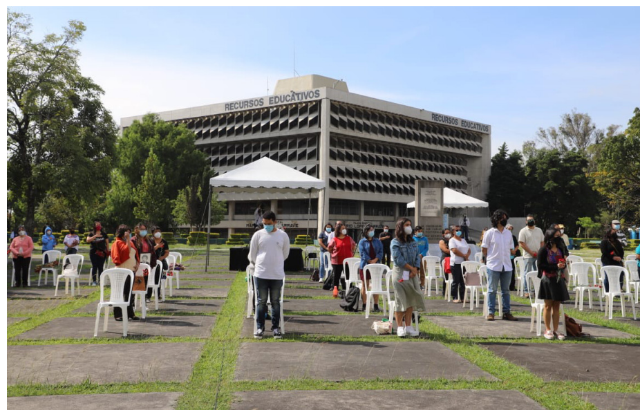
El acto protocolario se llevó a cabo en un marco de respeto y honra a las víctimas del conflicto armado interno.