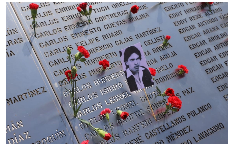
El Monumento de la Memoria Histórica fue vestido con los claveles rojos colocados por las familias de los héroes, heroínas y mártires sancarlistas.

Al finalizar el acto protocolario, las autoridades universitarias y los familiares de las víctimas colocaron el clavel rojo en el Monumento de la Memoria Histórica. Posteriormente, se realizaron diversas actividades culturales para concluir la jornada de dignificación.