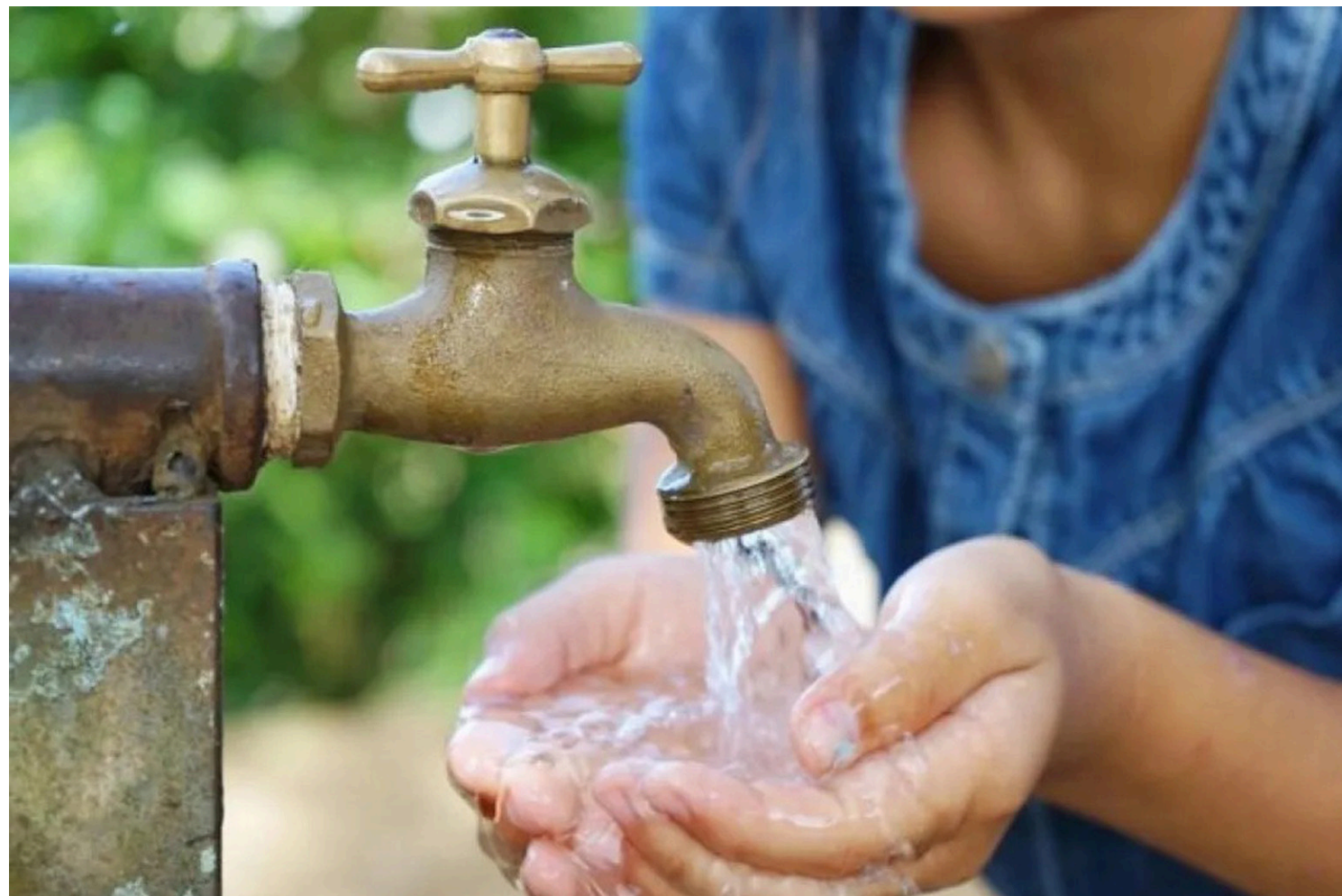
Cada vez hay menos agua para satisfacer las necesidades de la ciudad. Las zonas 21, 12, 7 y 18 presentan mayor escasez y más demanda por su densidad poblacional.

¿De dónde proviene el agua que utiliza la Ciudad de Guatemala? ¿Hay suficiente agua? ¿Existe un plan para reutilizarla? ¿Qué uso se le da? ¿Qué zonas consumen más agua? ¿Existe una relación entre las clases sociales y la distribución del agua?