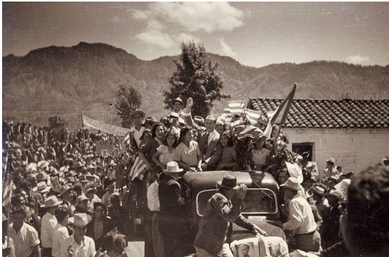
Jacobó Árbenz Guzmán ganó el apoyo y simpatía de los sectores populares por proponer reformas de beneficio para mejorar la calidad de vida.

En sus discursos destacó la necesidad de incrementar la producción agrícola mediante la industrialización y la necesidad de que esta fuera suficiente tanto para las demandas locales como de exportación. Promulgaba la unión del nuevo Ejército con el pueblo e indicaba que