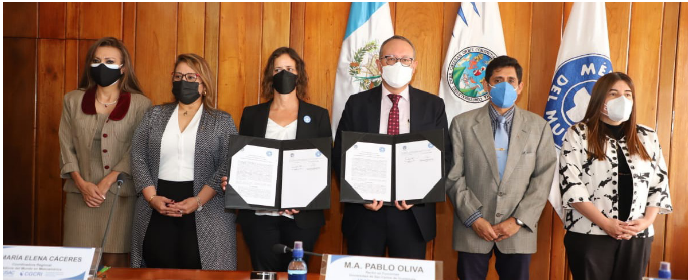
Autoridades de la Universidad de San Carlos de Guatemala estrecharon lazos de cooperación con Médicos del Mundo.

Por Ingrid Cárdenas