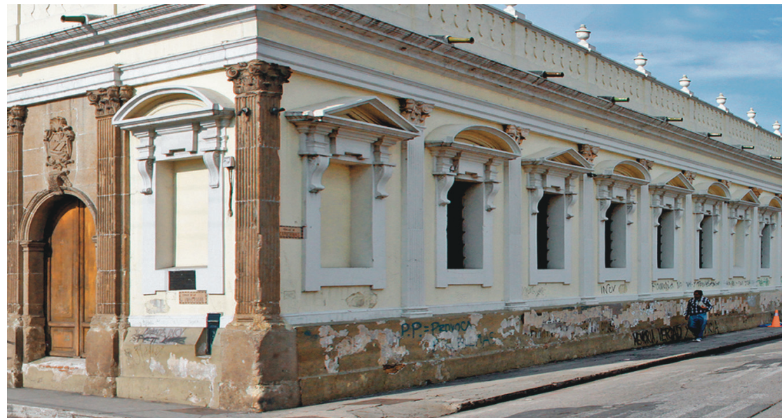
En los recintos universitarios, las primeras cátedras que se impartieron fueron Teología Escolástica, Teología Moral, Cánones, Leyes, Medicina y dos de lenguas.