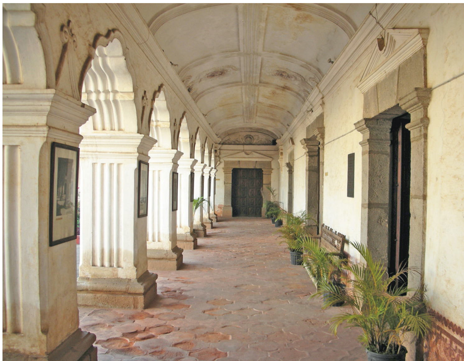
El Colegio Santo Tomás de Aquino, situado en Antigua Guatemala y dirigido inicialmente por los frailes dominicos, fue la primera sede de la Universidad de San Carlos.

El proceso para obtener este reconocimiento conllevaba la realización de una bula, la misma estuvo a cargo del papa Inocencio XI, otorgada por Carlos II. El docu-