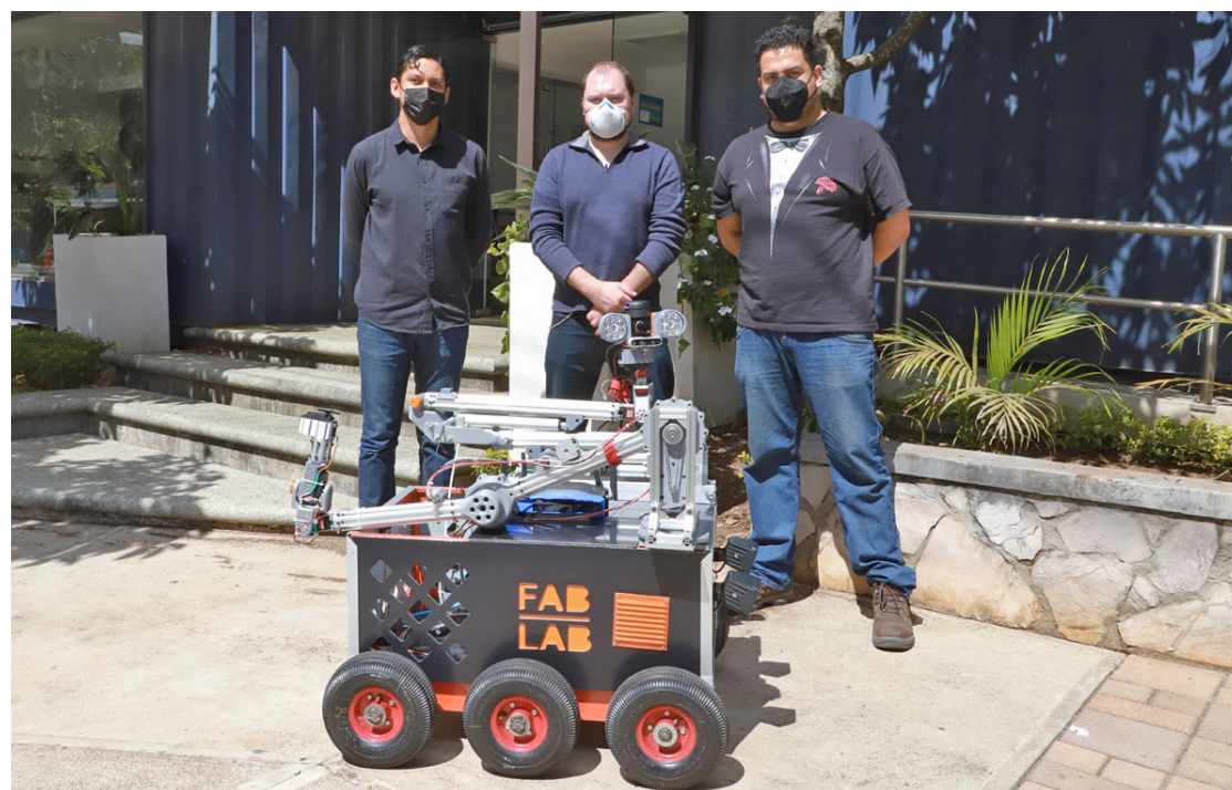
El robot es considerado como un prototipo, se espera que este primer modelo permita continuar el desarrollo tecnológico de la universidad.

Pablo Valiente comentó que el robot, incluso, podría ser utilizado para la fotogrametría con precisión alta; por ejemplo, en ruinas de difícil acceso, ya que es un robot modular, desmontable y adaptable para la utilidad requerida.