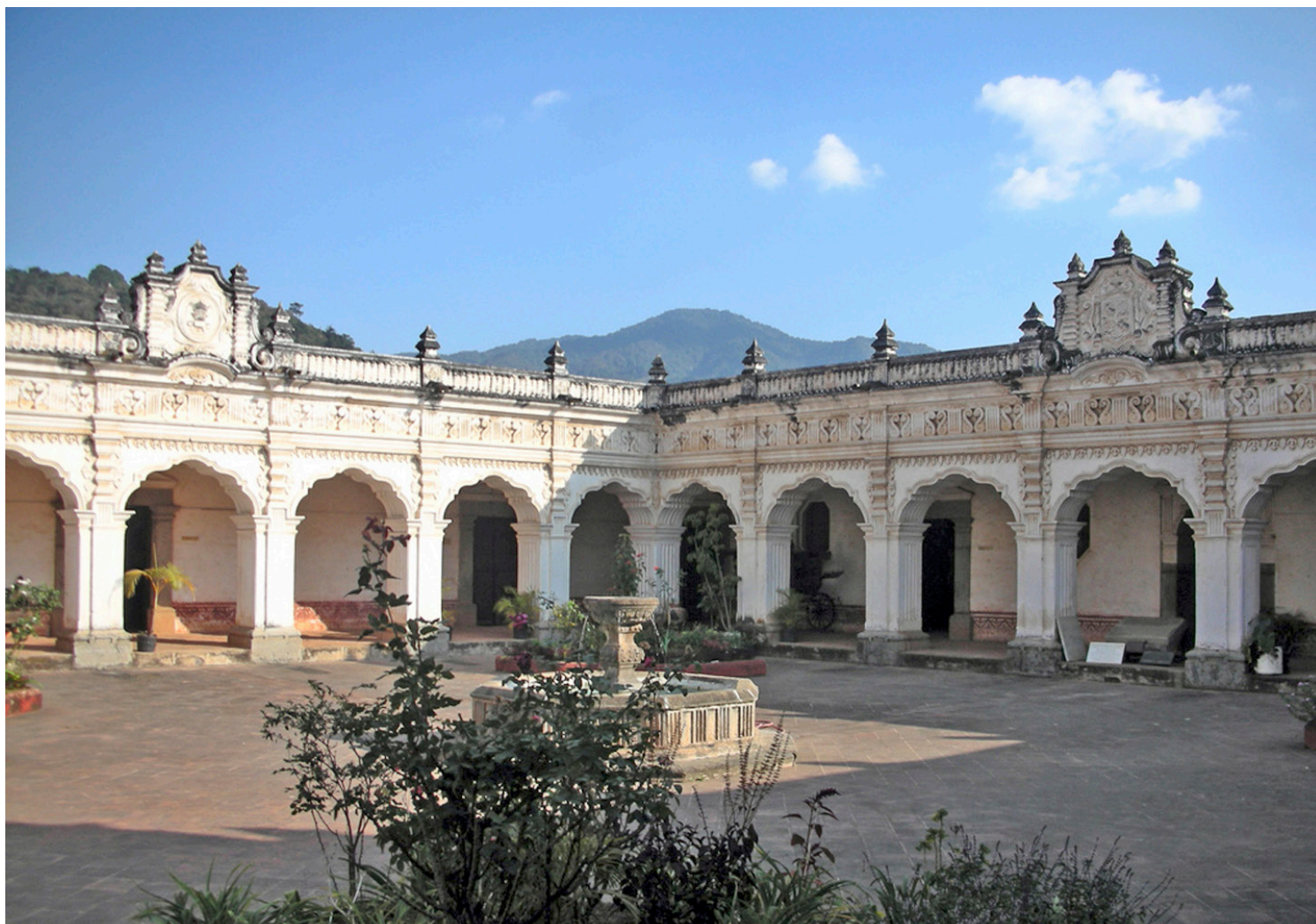
El Colegio Santo Tomás de Aquino impartía las cátedras de Prima de Teología, Derecho Canónico, Vísperas de Teología y Filosofía antes de que fuera instaurada la USAC.

Según indica Mata (2015), cinco días después de la deliberación de la junta universitaria, se pronunció el discurso del inicio de clases, el cual se escuchó en la Plaza de San Pedro, Plaza Mayor, plazas del Barrio San Sebastián, Barrio de Santo Domingo, Plazuela y Cementerio del Convento de Santo Domingo, así como en las puertas de la universidad.