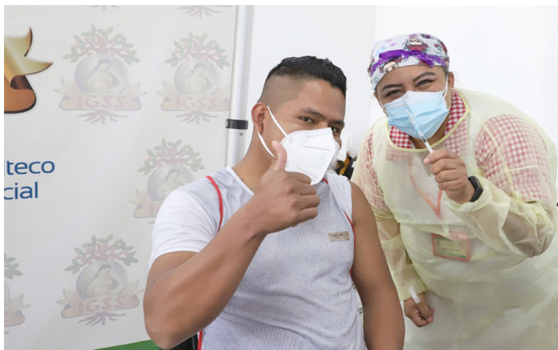
Se tiene contemplado que el centro de vacunación del IGSS, ubicado en la USAC, funcione durante todo el primer semestre y podría continuar atendiendo por más tiempo, de ser necesario.

La cartera de salud recomienda que quienes padecieron la enfermedad deben vacunarse 90 días después de haber obtenido un resultado negativo, este criterio se aplica para las diferentes dosis