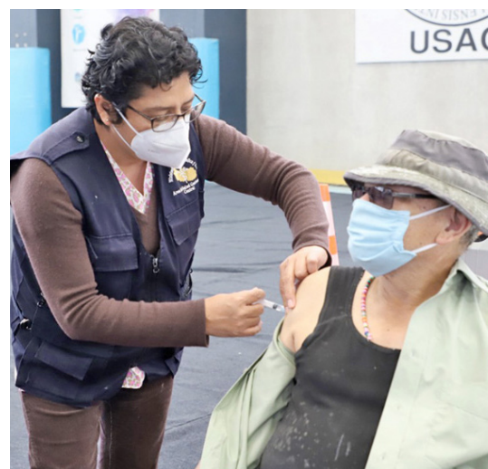
En el centro de vacunación del Polideportivo, los trabajadores de la USAC atienden a la población guatemalteca.