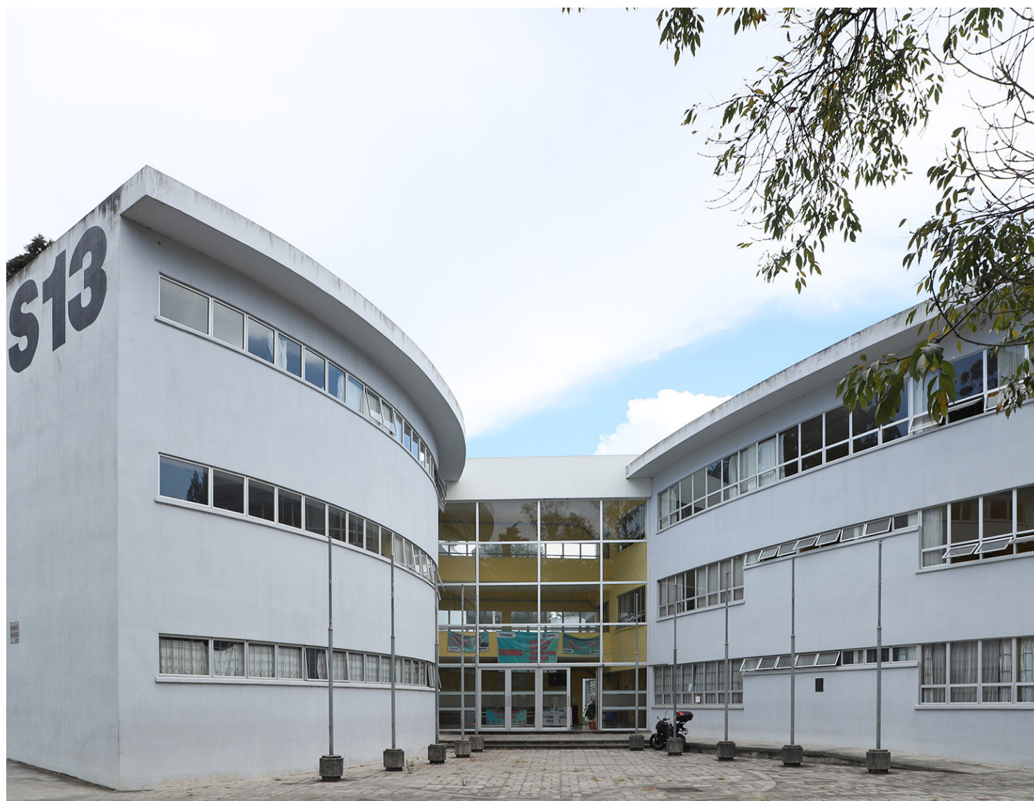
Actualmente CALUSAC imparte 16 idiomas. Las inscripciones se realizan cada bimestre, el primero inicia en febrero.

Los cursos regulares están disponibles para toda la población (estudiantes, trabajadores, adolescentes y extranjeros). Las inscripciones se llevan a cabo cada dos meses. El primer bimestre inicia en