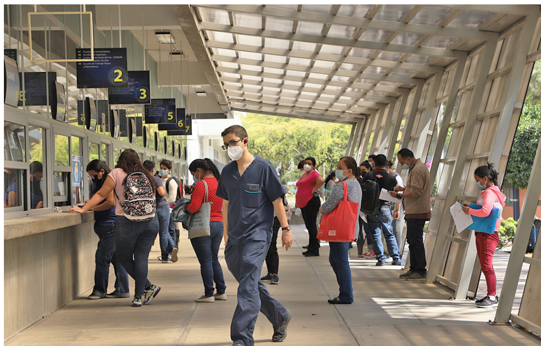
Las inscripciones se están llevando a cabo en línea, a excepción de casos especiales, los cuales se atienden presencialmente.

Después, la plataforma mostrará el nombre, nacionalidad y lugar de nacimiento, teléfono, dirección, correo y los datos del establecimiento educativo donde el aspirante cursó la carrera de nivel