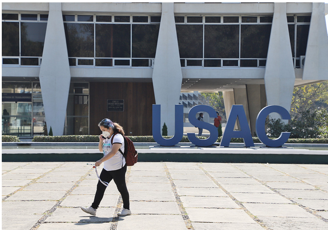
La Universidad de San Carlos de Guatemala ofrece a la población distintas opciones de apoyo económico mediante el Programa de Becas de Pregrado.

beca para estudiantes de pregrado se llevará a cabo del 1 al 28 de febrero de 2022 en la página https://becas.usac.edu.gt/index.php/exoneraciones/ .